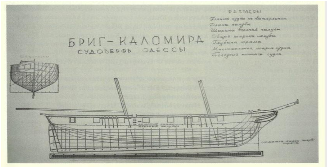
Σκίτσο της Καλομοίρας από το Ναυτικό Μουσείο Οδησσού, όπου και κατασκευάστηκε το πλοίο