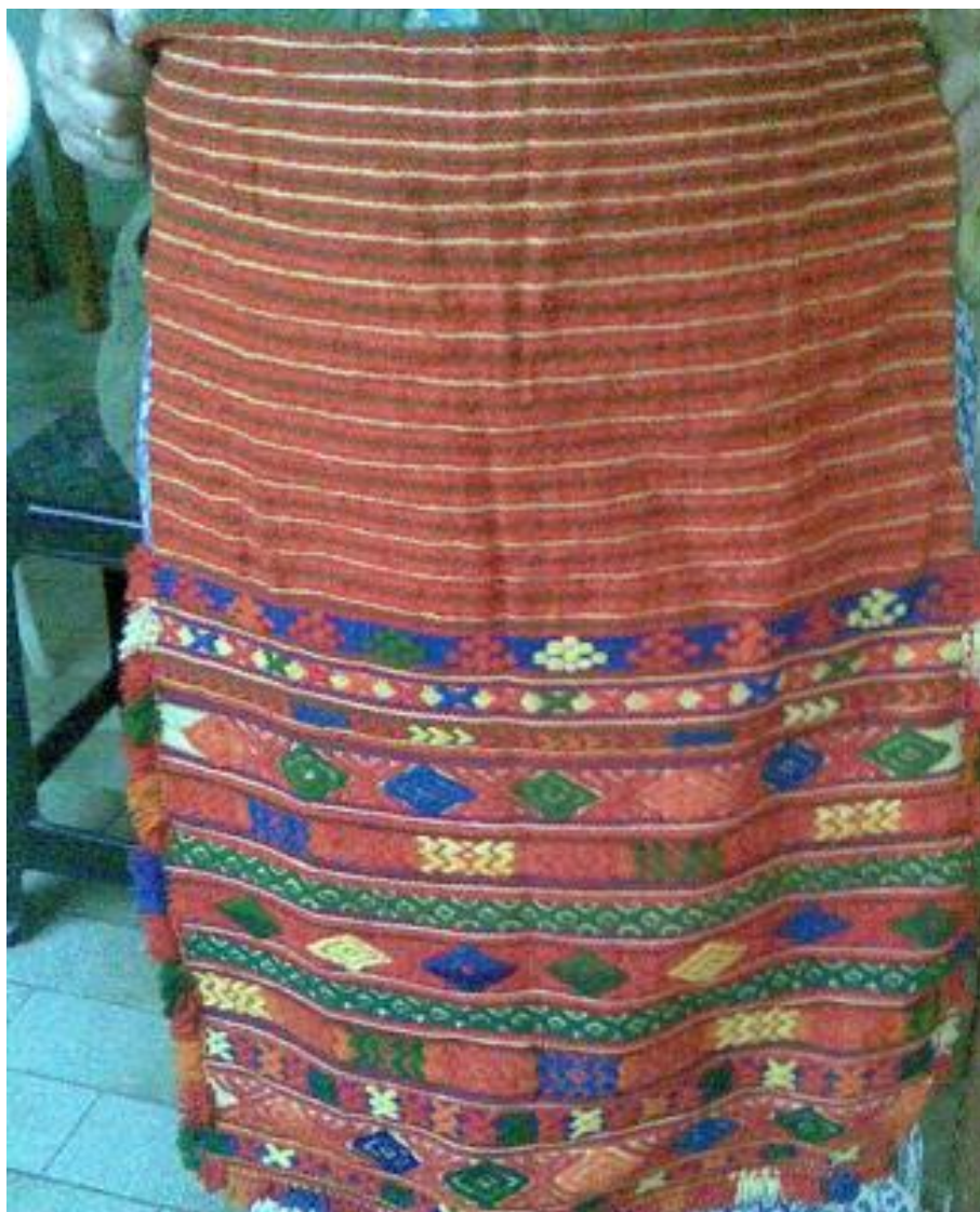
ΑΡΧΕΙΟ Β ΜΠΙΣΜΠΙΚΟΠΟΥΛΟΥ

Υφαντή γιορτινή ποδιά του 19 ο αιώνα κατασκευασμένη στον αργαλειό εξ ολοκλήρου από ακατέργαστες πρώτες ύλες της περιοχής.