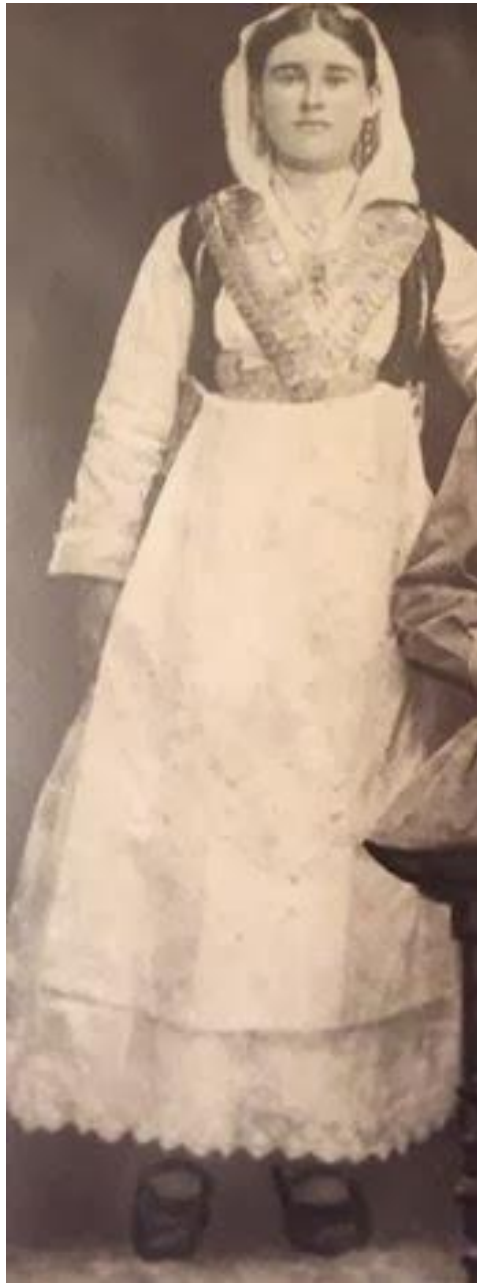
ΑΡΧΕΙΟ ΟΙΚΟΓΕΝΕΙΑΣ ΓΕΩΡΓΙΟΥ

Το μετάξι χρησιμοποιείται για την κατασκευή κυρίως της νυφικής φορεσιάς. Κάνει την εμφάνισή του από το 1900 και έπειτα.