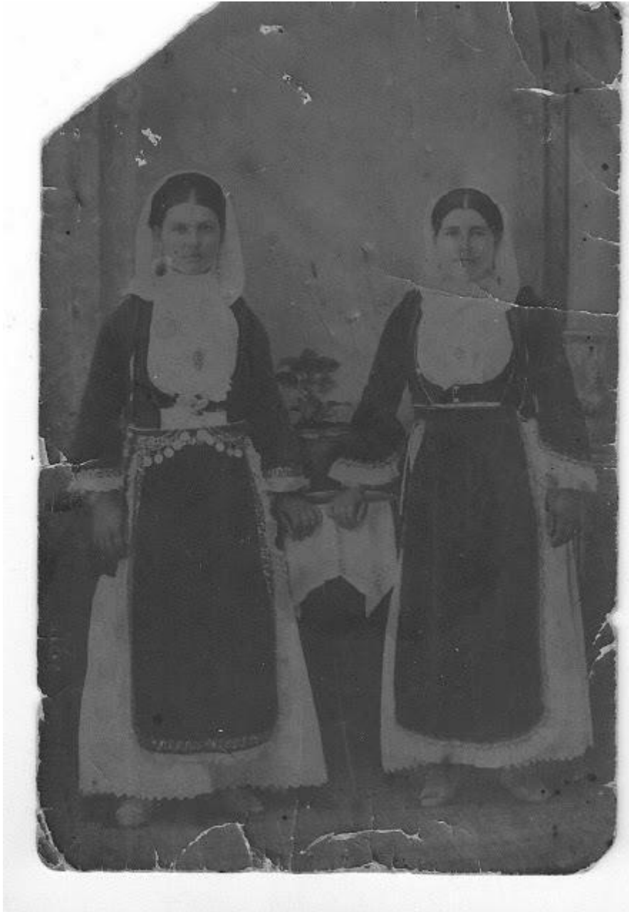
ΑΡΧΕΙΟ ΟΙΚΟΓΕΝΕΙΑΣ ΜΠΙΣΜΠΙΚΟΠΟΥΛΟΥ

Το βελούδο ύφασμα κάνει την εμφάνισή του από το 1890 και χρησιμοποιείται για την κατασκευή της νυφικής και γιορτινής φορεσιάς. Είναι μια περίοδος με μεγάλη οικονομική και κοινωνική ανάπτυξη στην περιοχή μας.