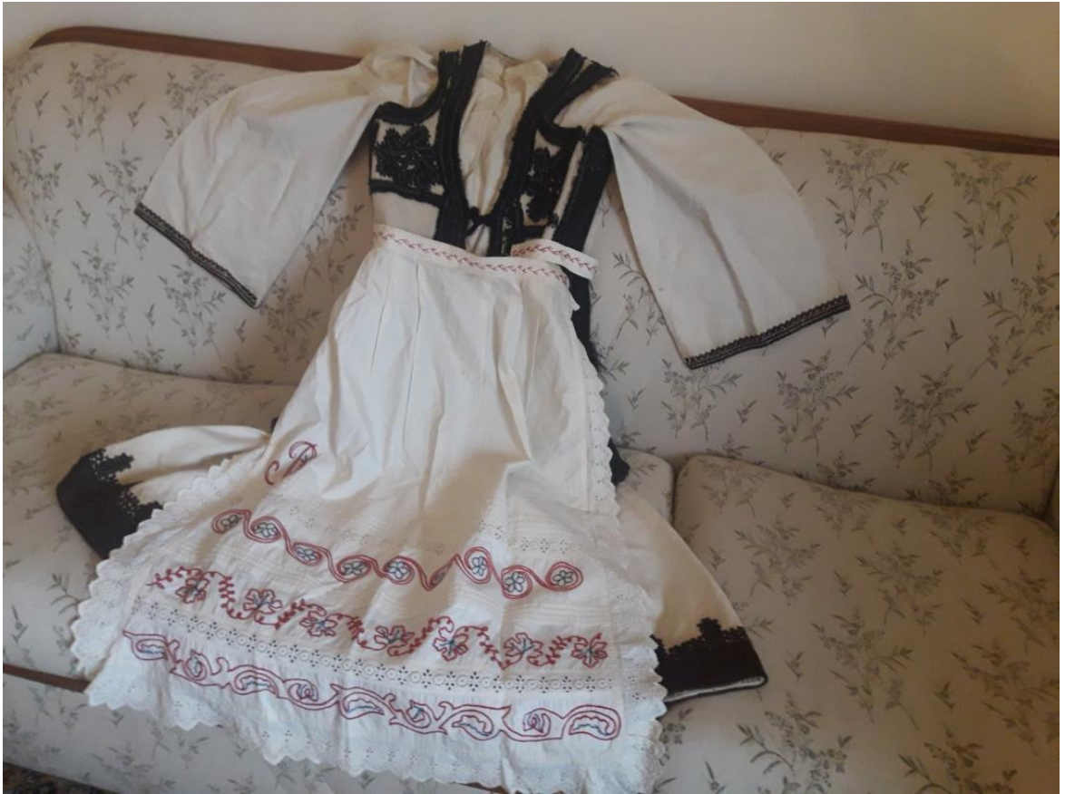
ΑΡΧΕΙΟ ΕΛΕΝΗΣ ΜΠΙΣΜΠΙΚΟΠΟΥΛΟΥ