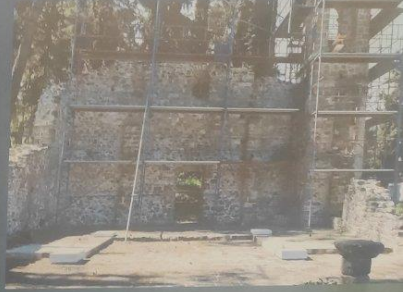
Δήμος Μακρακώμης / Ι. Ν. Α.